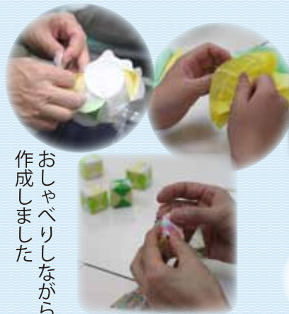
おしゃべりしながら 作成しました

4月から始めた『七夕飾りづくり』も 全体像が見えてきました。 来月の仕上げが楽しみです。 どんな飾りになるでしょう。