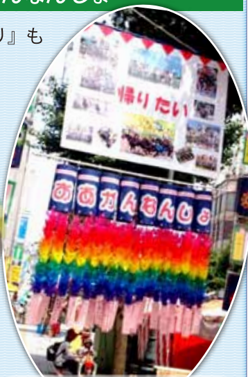
昨年、銅賞をいただいた おあがんなんしよの七夕飾り