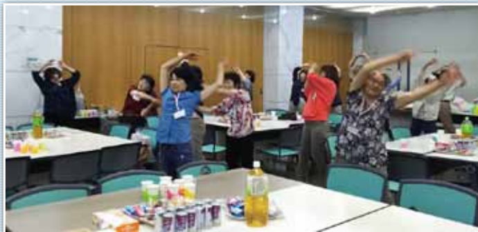
ラジオ体操で全身運動

日時 / 8月6日 (土) 11:30 ~ 場所 / 天七 (前回食事会と同じ) ※食事会の後、七夕飾りを見学