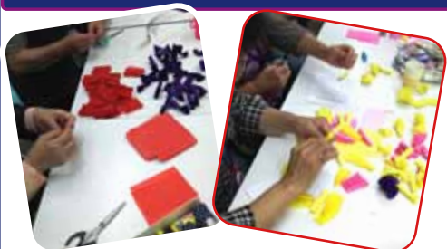
全員でお花作り、 出来上がりが楽しみです

空梅雨ですが、紫陽花が多彩の花をつけました。 ストレッチは「イタツ！キモチイイ」。 頭の体操では硬～い脳の動きを実感させられま した。飾り作りでは「コツコツ モクモク ニコニコ」 で、会話が弾みました。