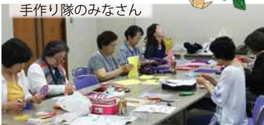
交流会の七夕飾りパーツの作業準備↑