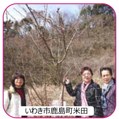
いわき市鹿島町米田